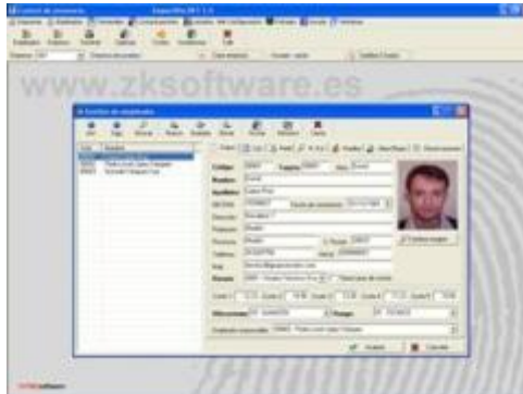
ZKTime Pro-EU: Ficha do Empregado